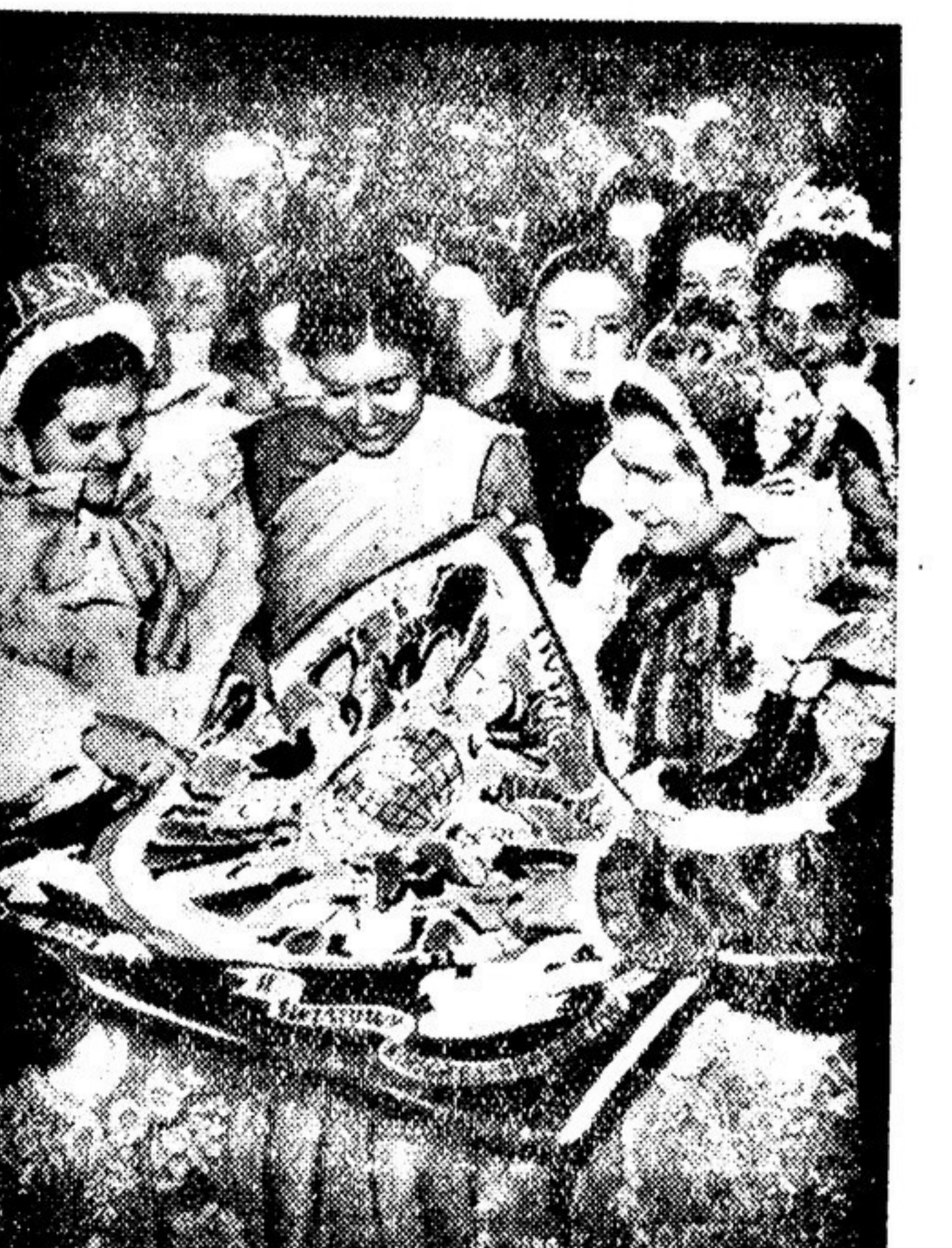
Варшава. Второй Всемирный конгресс сторонников мира. НА СНИМКЕ: делегаты рассматривают платок мира, преподнесенный конгрессом.

На снимке: сборка автомобилей «ЗИМ» на Горьковском автозаводе имени В. М. Молотова. Текст О. ОПАРИНА.