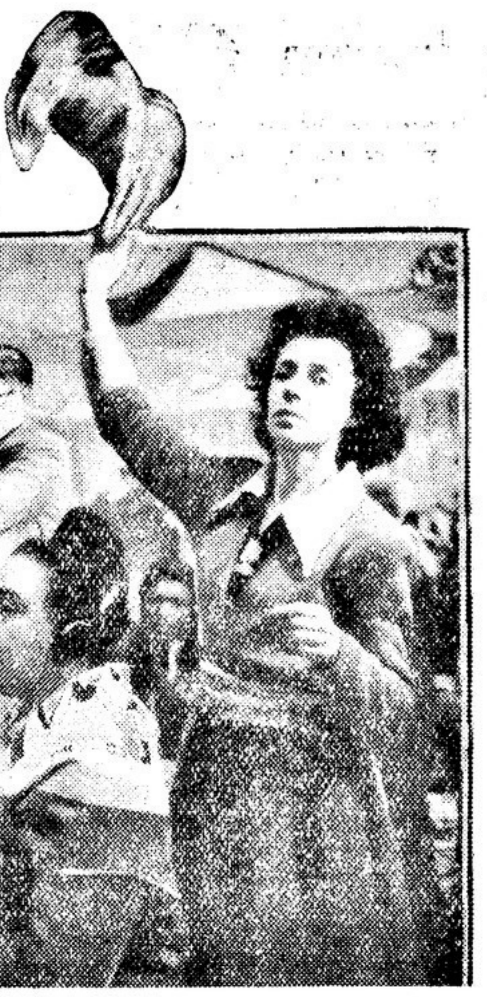
Варшава. Второго Всемирного конгресса сторонников мира. НА СНИМКЕ: в зале заседаний конгресса. Делегаты приветствуют членов Всемирного Совета мира.

Ответы делегатов Второго Всемирного конгресса сторонников мира на вопросы «Литературной газеты»